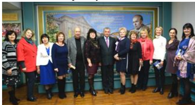
Учасники обласного семінару працівників закладів позашкільної освіти на екскурсії в музеї історії освіти Корсунь-Шевченківщини

Центр експозиції присвячений Дитині, дитиноцентризму: на колонах презентовані фотосвітлини дітей, дитячих колективів – які символізують загальну мету освіти, основу всієї діяльності педагогів – це плекання дитини, розвиток її здібностей, виховання підрастаючого покоління на загальнолюдських цінностях. За ідейним задумом авторів експозиції тут розміщені фото саме вихованців позашкільного закладу – натхненних творчістю, як яскравого прикладу вільного, творчого, різнобічного розвитку і формування життєвих компетентностей особистості. Ця ідея має продовження в Галереї пошани наших вихованців «Древо життя», яка містить фото талановитих, обдарованих гуртківців, лідерів учнівського самоврядування, випускників Центру творчості, які завдячуючи позашкільній освіті знайшли себе у дорослому житті, у професійній діяльності, і тому ними пишається наш колектив і наше місто.