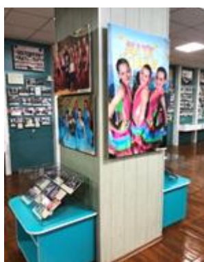
Центр експозиції музею присвячений Дитині, дитиноцентризму