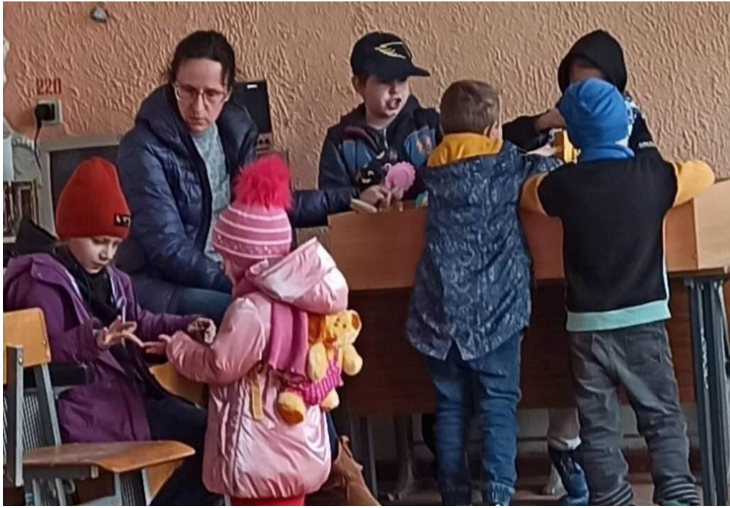
Оберіг для дітей "Зайчик на пальчик".