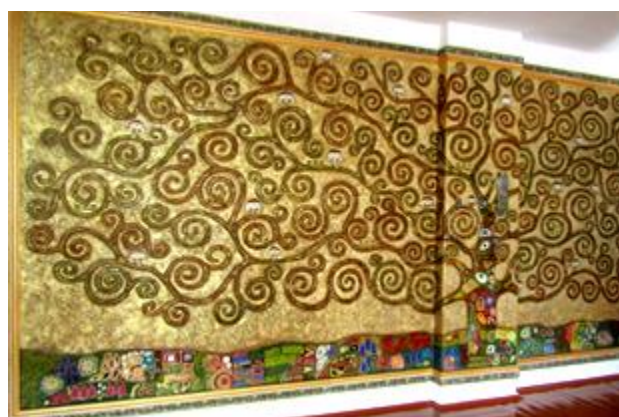
Галерея пошани вихованців «Древо життя»

Домінуюча роль у нашому Центрі творчості належить діяльнісному підходу , сутність якого полягає у реалізації на практиці здобутих учнями знань, сформованих умінь та навичок у конкретній життєвій ситуації. За такого підходу зміст освітнього процесу розглядається як педагогічна модель