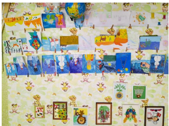
Виставки робіт гуртківців