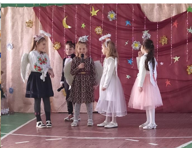
Прикрашаємо сцену та виступаємо