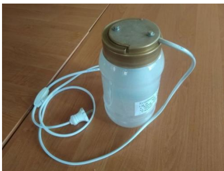
Садовий ліхтар ( вторинне використання пластимаси)