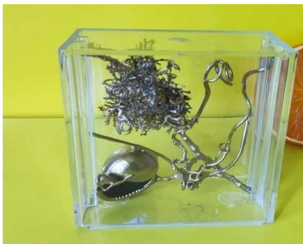
Робота з природного матеріалу