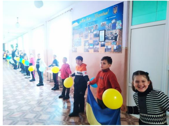
День Соборності України