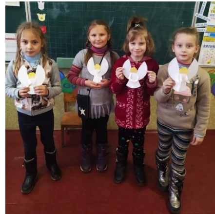
Янголи – душі героїв Небесної Сотні