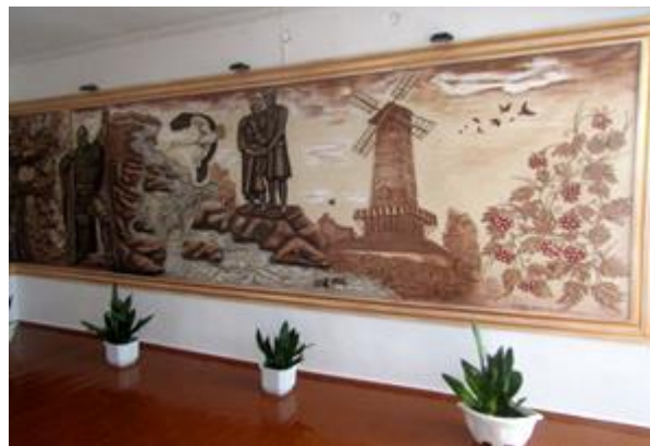
Барельєфне панно «Рідна Корсунська земля нам душу й тіло окриля» створене працівниками ЦДМТ

Планування і дизайн освітнього простору Центру творчості спрямований на виховання і розвиток дитини, її мотивацію до навчання у закладі позашкільної освіти. Художньо-естетичне оформлення холів, навчальних кабінетів, створення комфортних умов, доброзичлива морально-психологічна атмосфера – все це сприяє якійсь позашкільній освіті, – такі переконання має наш колектив на чолі з директором Т.П.Фурсою.