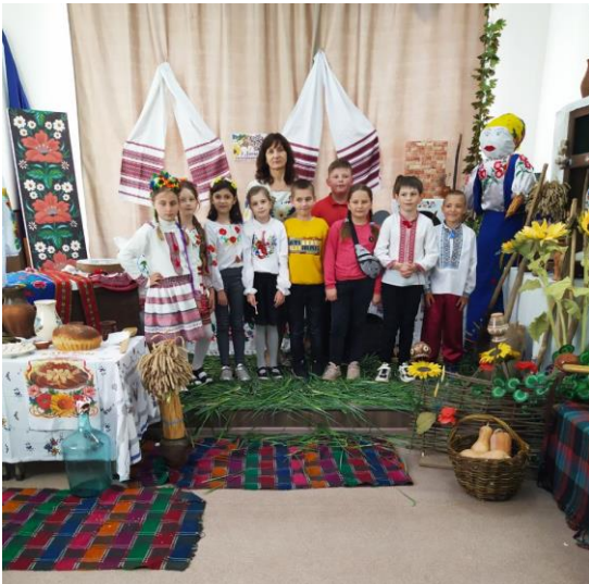
День української вишиванки