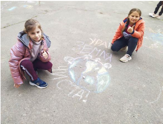
Малюнок на асфальті до дня Землі