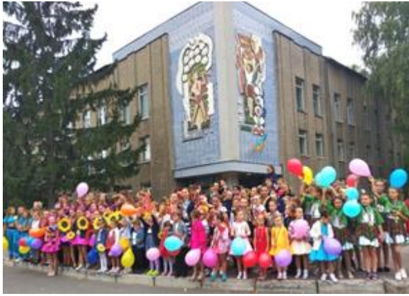
Корсунь-Шевченківський центр дитячої та молодіжної творчості