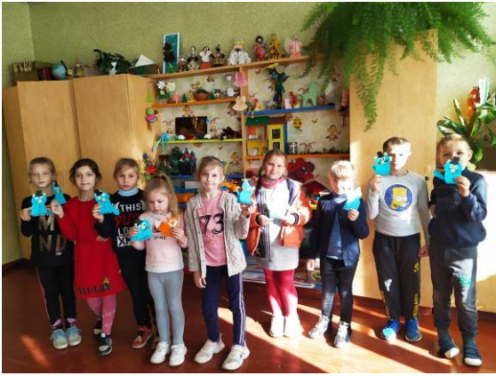
Подарунки вихованцям з дитячого садка